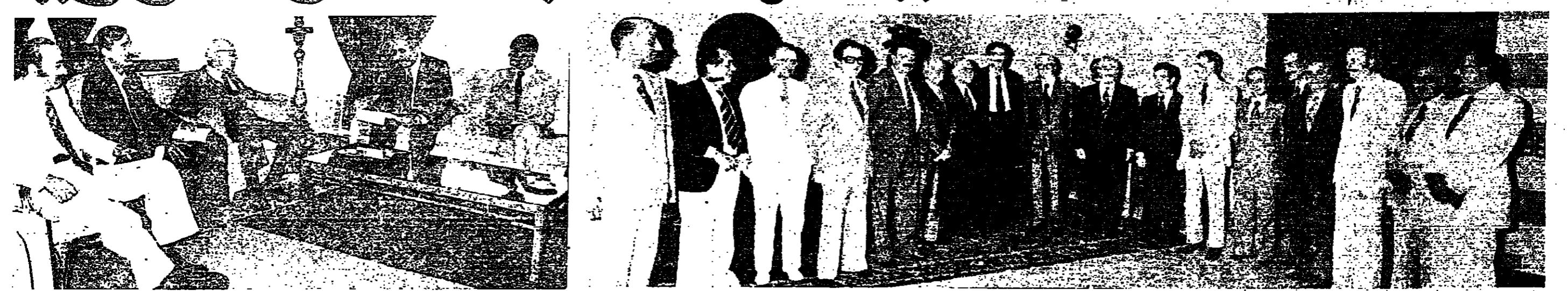
اعضاء هيئة الحوار الوطني أثناء التوقيع في قصر بعبدا امس ، ويبدو الرئيس كميل شمعون وقد وقف الى جانبه السيد كمال جنبلاط ، يحيط بهما الرئيس كرامي ، السيد عبيد الطيم خدام ، والرئيسان مسلام والياق وسائر اعضاء الهيئة